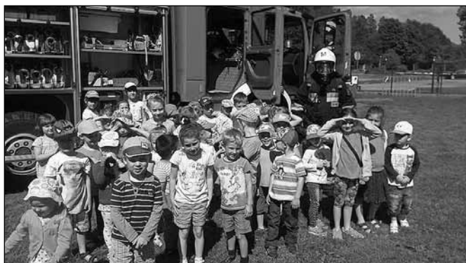
fot. Przedszkole nr 3