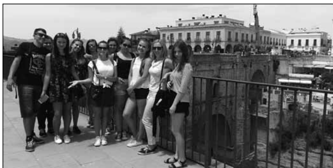
fol. ZSGH im. W. Reymonta